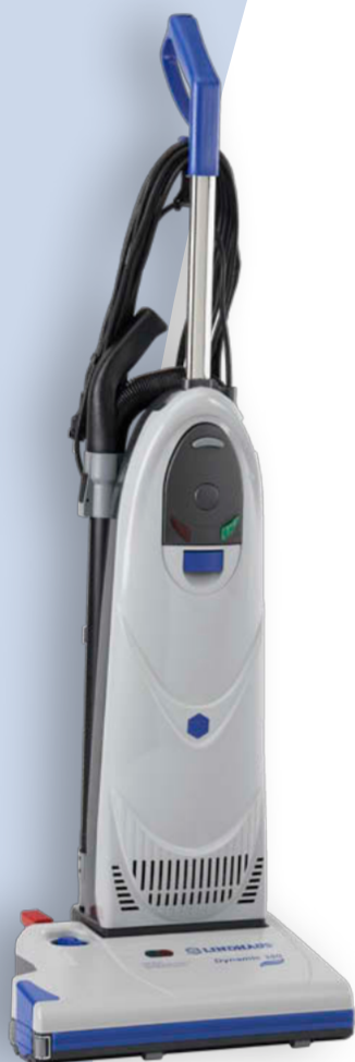
DYNAMIC eF 380e