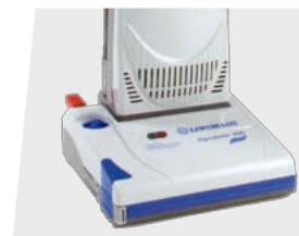
DYNAMIC eF 300e