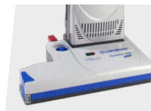
DYNAMIC eF 450e